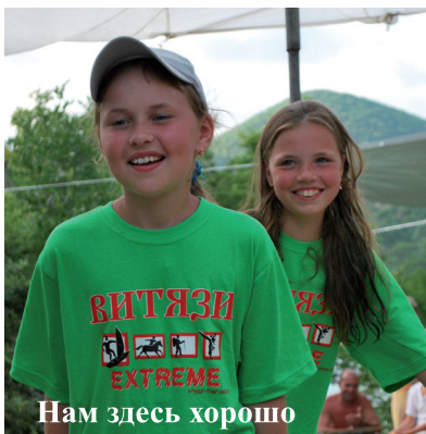
Нам здесь хорошо