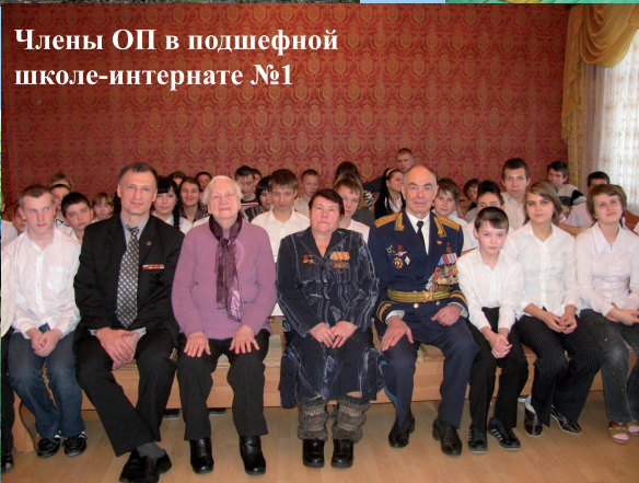
Члены ОП в подшефной школе-интернате №1