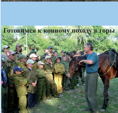
Готовимся к конному походу в горы