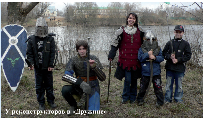
У реконструкторов в «Дружине»