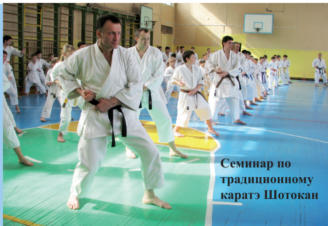
Семинар по традиционному каратэ Шотокан