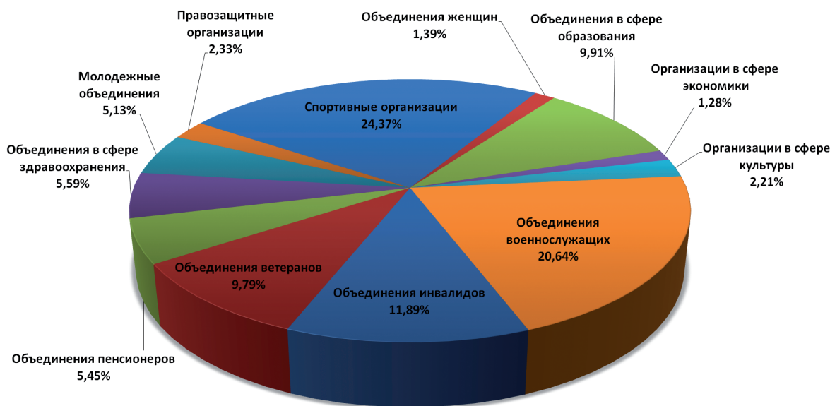
Распределение некоммерческих организаций Тверской области по видам деятельности (по состоянию на 1 января 2011 г.)

Сокращение численности НКО вызвано в основном тем фактом, что некоторые организации в течение длительного времени фактически бездействовали, не представляли отчёты о своей работе, что является грубым нарушением ФЗ «Об общественных объединениях», статья 29.