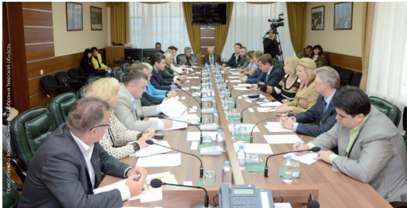
Пресс-служба Законодательного Собрания Тверской области