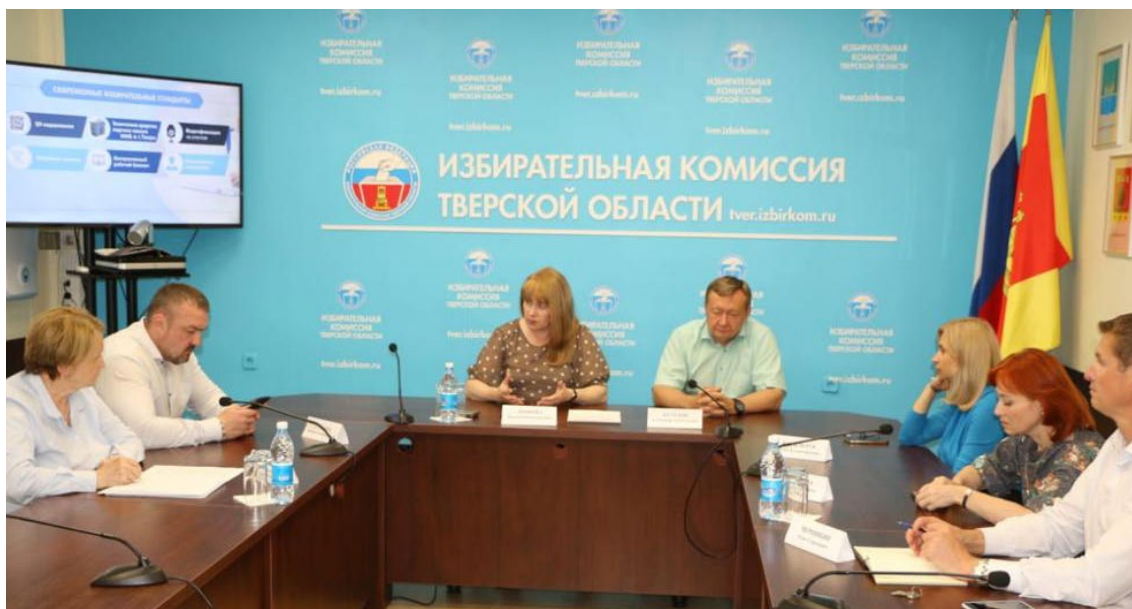
Рабочая встреча с членами Избирательной комиссии Тверской области