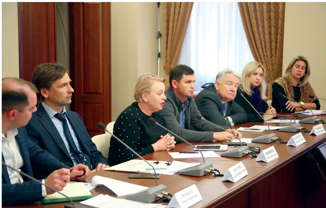
Рабочая встреча в Тверской городской Думе

жилищно-коммунальным комплексом и оборота твердых коммунальных отходов, проинформировать общественность.