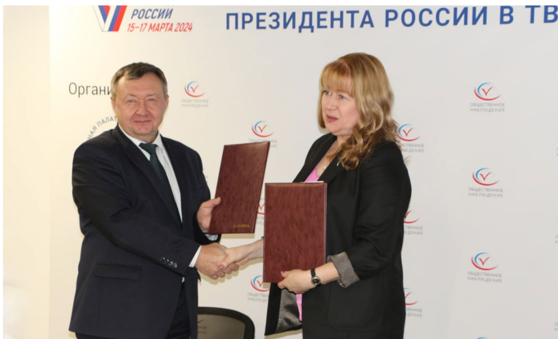
Подписание Соглашения о сотрудничестве между Региональным штабом общественного наблюдения и Избирательной комиссией Тверской области в целях обеспечения участия представителей гражданского общества Тверской области в наблюдении за проведением выборов на территории Тверской области.

За эти годы Общественная палата Тверской области и региональный штаб наблюдения не зафиксировали ни одного случая противодействия представителям гражданского общества со стороны избирательных комиссий, ограничения права наблюдать за ходом голосования, подсчетом голосов, определением результата выборов. Избирательная комиссия