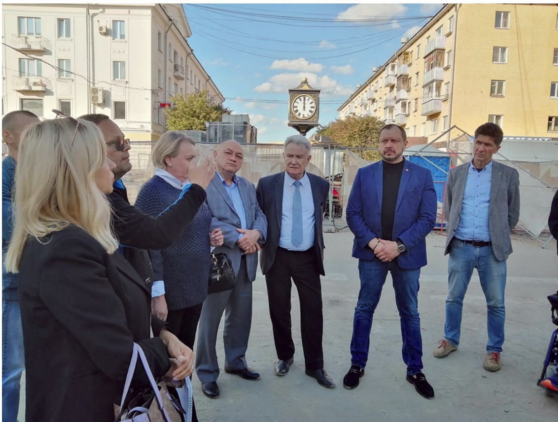
Группа общественного контроля на пешеходной улице Трёхсвятская в г. Твери

Благоустройство главной пешеходной зоны города — улицы Трёхсвятской в 2023 году организовано в рамках федерального проекта «Формирование комфортной городской среды». На первом этапе работы предусмотрены на участке от улицы Новоторжской до бульвара Радищева.