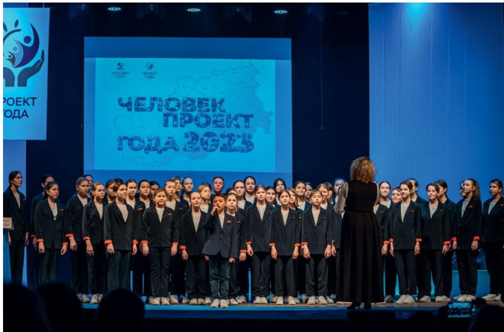
Исполняется Гимн Российской Федерации. Хор «Глория»