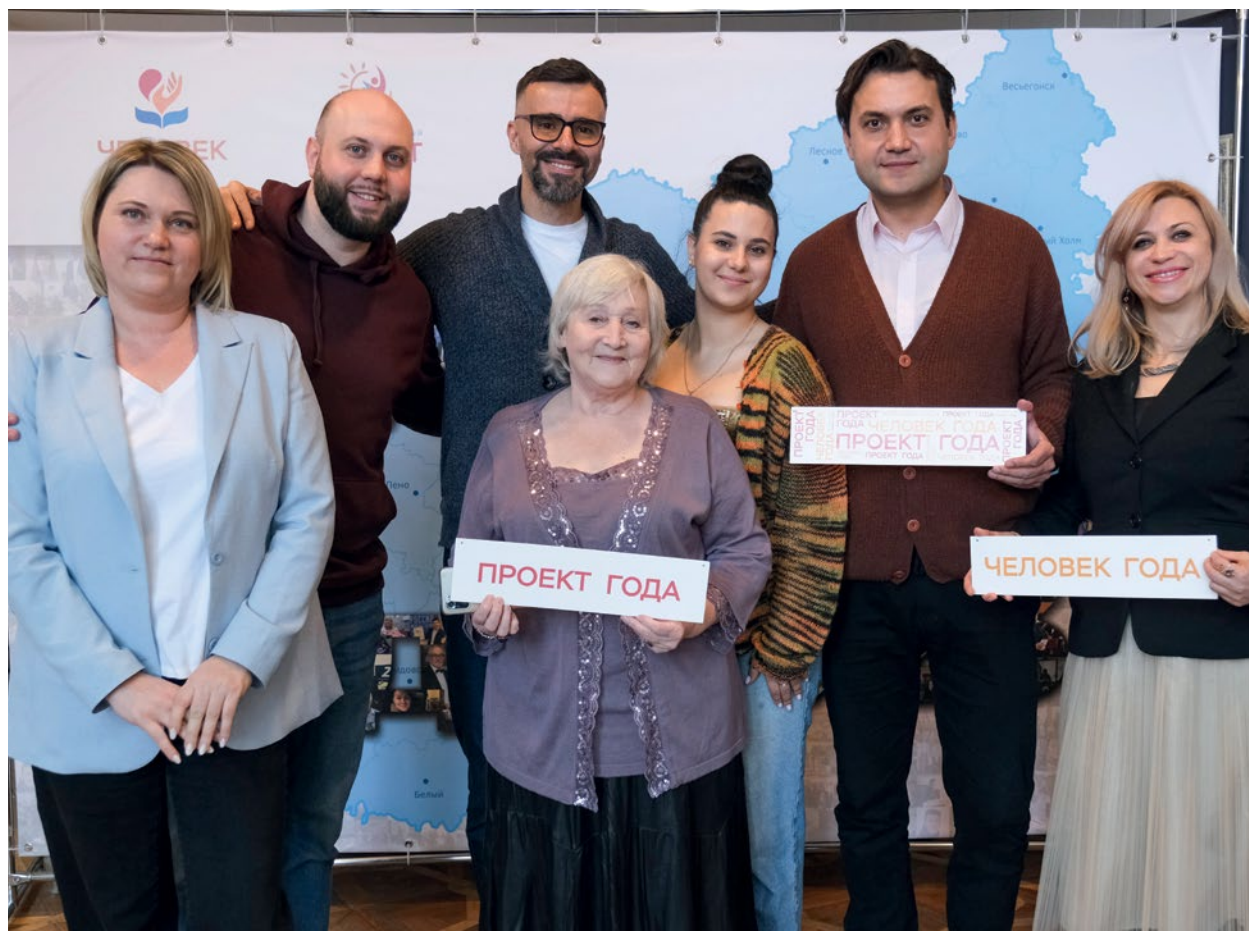
РЕГИОНАЛЬНЫЙ КОНКУРС «ЧЕЛОВЕК ГОДА», «ЛУЧШИЙ СОЦИАЛЬНЫЙ ПРОЕКТ ГОДА» В ТВЕРСКОЙ ОБЛАСТИ ПО ИТОГАМ 2023 ГОДА