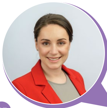
Юлия Владимировна Саранова депутат Государственной Думы Федерального Собрания Российской Федерации