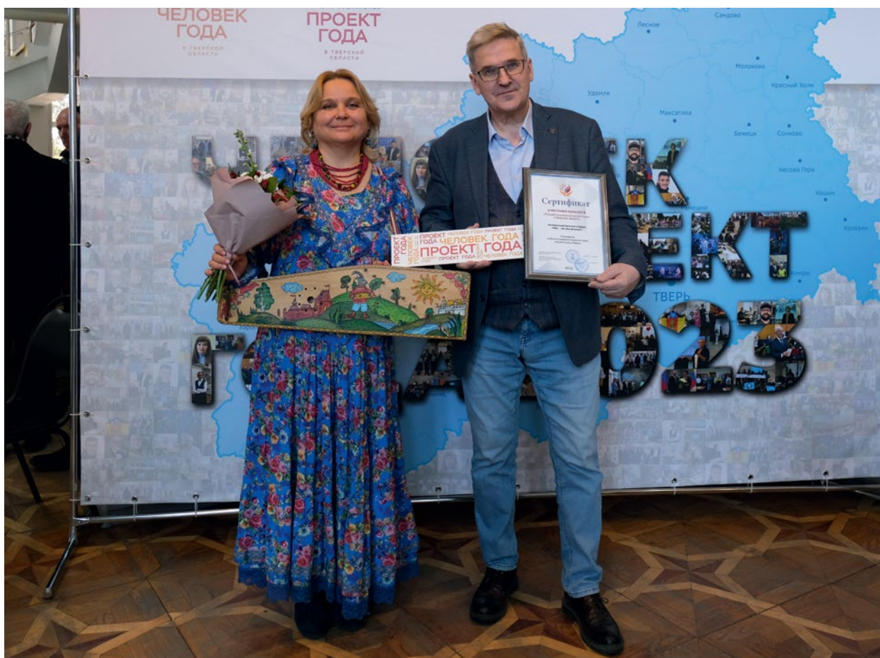
РЕГИОНАЛЬНЫЙ КОНКУРС «ЧЕЛОВЕК ГОДА», «ЛУЧШИЙ СОЦИАЛЬНЫЙ ПРОЕКТ ГОДА» В ТВЕРСКОЙ ОБЛАСТИ ПО ИТОГАМ 2023 ГОДА