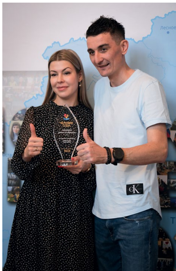
РЕГИОНАЛЬНЫЙ КОНКУРС «ЧЕЛОВЕК ГОДА», «ЛУЧШИЙ СОЦИАЛЬНЫЙ ПРОЕКТ ГОДА» В ТВЕРСКОЙ ОБЛАСТИ ПО ИТОГАМ 2023 ГОДА