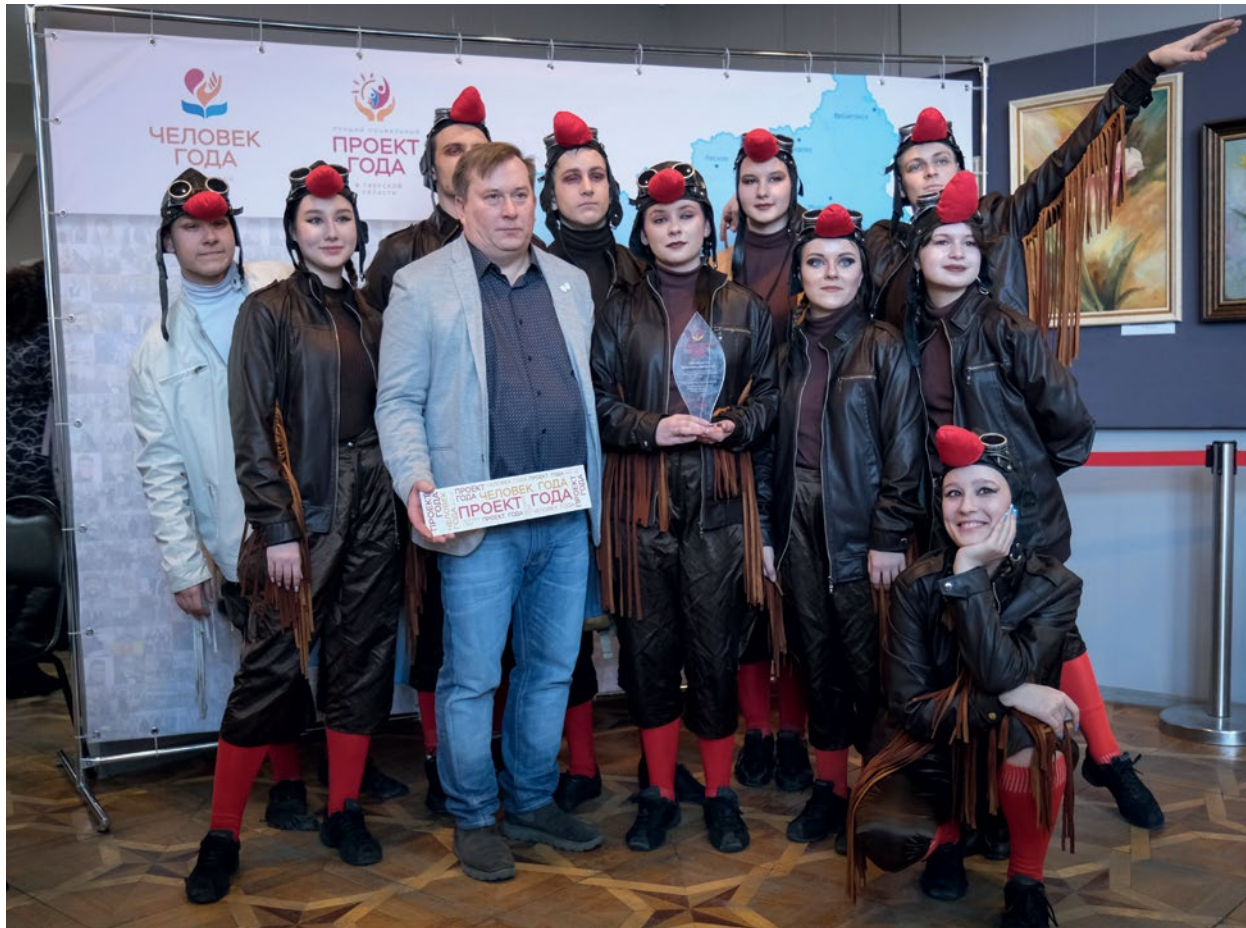
РЕГИОНАЛЬНЫЙ КОНКУРС «ЧЕЛОВЕК ГОДА», «ЛУЧШИЙ СОЦИАЛЬНЫЙ ПРОЕКТ ГОДА» В ТВЕРСКОЙ ОБЛАСТИ ПО ИТОГАМ 2023 ГОДА