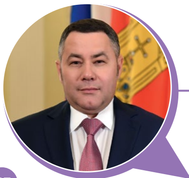
Игорь Михайлович Руденя Губернатор Тверской области