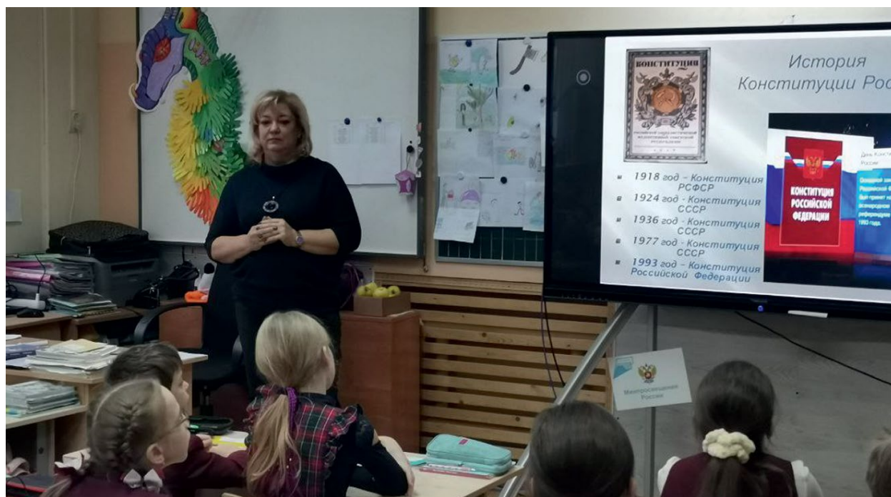
Изучаем историю Родины