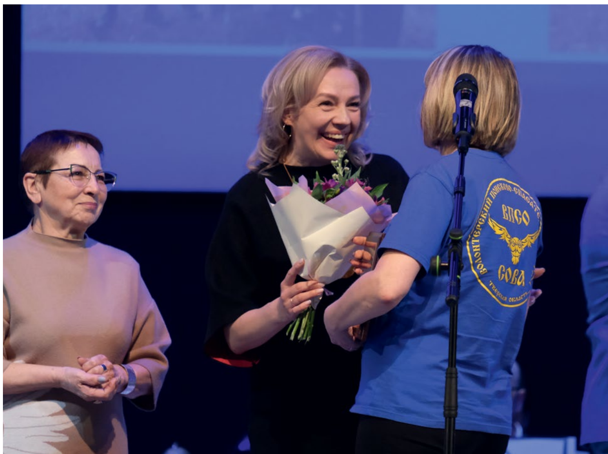
РЕГИОНАЛЬНЫЙ КОНКУРС «ЧЕЛОВЕК ГОДА», «ЛУЧШИЙ СОЦИАЛЬНЫЙ ПРОЕКТ ГОДА» В ТВЕРСКОЙ ОБЛАСТИ ПО ИТОГАМ 2023 ГОДА